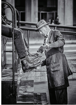
© Mark Coggins / Drive in Up (San Francisco, 2017)