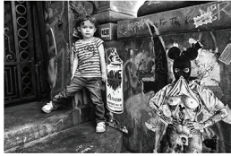
© Karen Klugman / N. Boney (2016)