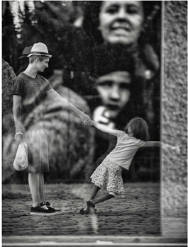
© William Bullard / Memorial To the Victims of 9/11 & Fascism (2016)