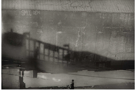
© Natsuko Matsumura / Jewel in New York #15 (New York, 2016)